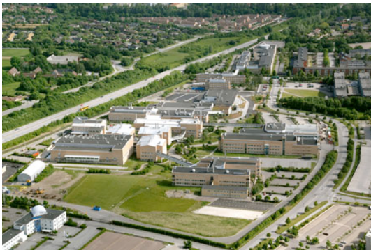
Medicon Village i Lund