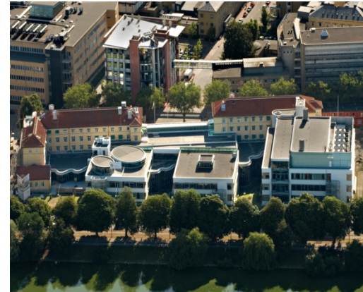
Clinical Research Centre, CRC, i Malmö