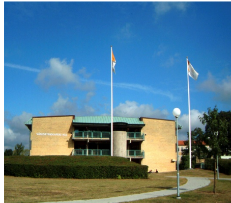
Health Sciences Centre, HSC, i Lund