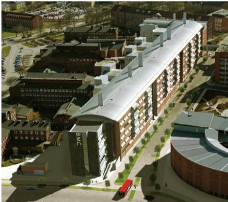
Biomedicinskt centrum, BMC, i Lund

Forskning och utbildning inom Medicinska fakulteten finns samlad i fyra byggnader i Lund och Malmö